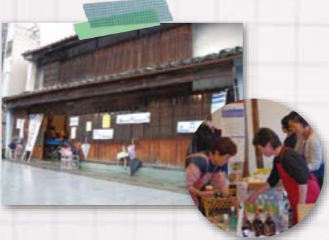
※ホームページに詳細を掲載しています。 http://kirari-honmachi.ciao.jp/

お披露目のイベントとして、昨年の11月19日(土)に「うだつマルシェ」という、手作り市を行いました。三好市在住の食べ物や雑貨を手作りで作っている方を中心に、お隣の美馬市、高知県大豊町と本山町の協力隊の方たちにもご参加頂きました。当日はあいにくの雨模様だった