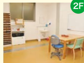
● 言語聴覚室 小児の発達の援助や発音の練習、摂食・嚥下機能の向上や実践の適応を訓練します。