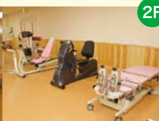
● 厨房 患者さんの病状に応じた様々な食事を提供します。