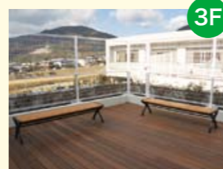
● 屋上庭園 河川整備による公園や遊歩道が整った河内谷が一望できる癒しの場所です。