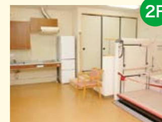
● ADL室 食事、排泄、着脱衣、入浴など、日常生活を送るための基本動作を練習します。