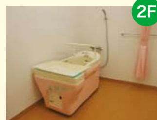
● 水治療室 温水を用いて筋肉や関節周囲の組織のリラゲーションを行います。