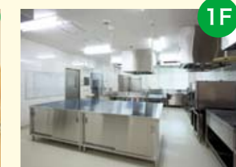
● 厨房 患者さんの病状に応じた様々な食事を提供します。