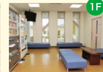
● 外来ラウンジサロン 患者さんや付き添いの家族の方の憩いの場です。自動販売機も設置しています。