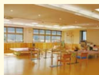
● リハビリテーション室 おもに運動療法を行います。数種類のパワーリハの機器や物理療法で機能回復を行います。