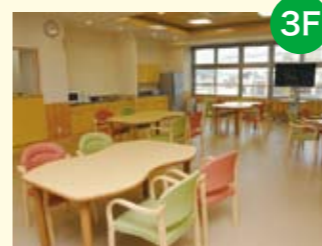
● 食堂ダイルム 病室外で食事ができる広々とした空間です。家族との団らんにもご利用ください。

新築された入院棟は、地上3階のべ2170㎡、病床数30床、1期工事分と合わせ一般病床60床の病院に生まれ変わりました。3階には入院患者さんたちが食事をしながらつるげる食堂ダイルムがあります。2階には広々としたリハビリテーション室があります。日常生活を再現した部屋もあり、回復期のリハビリテーション機能を充実しました。また、1階にはオール電化された厨房があります。